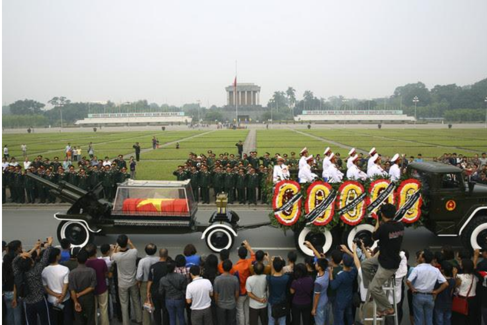
Đám tang tướng Võ Nguyên Giáp (13/10/2013).

Cuối cùng, câu sấm truyền trong dân gian đem lại chút ít niềm tin cho những ai theo xu hướng thay đổi: