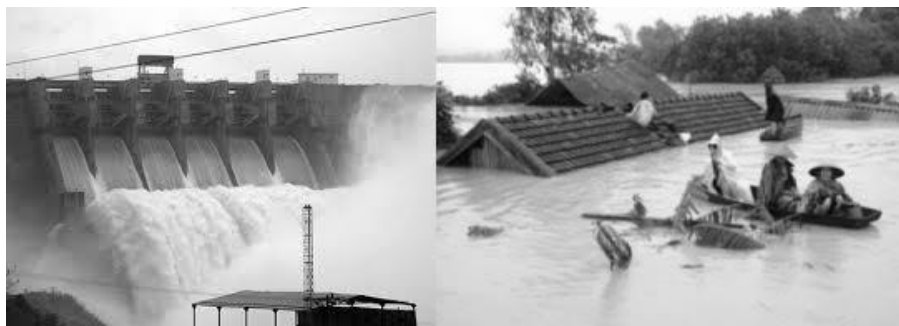
Nguyên nhân và hậu quả.