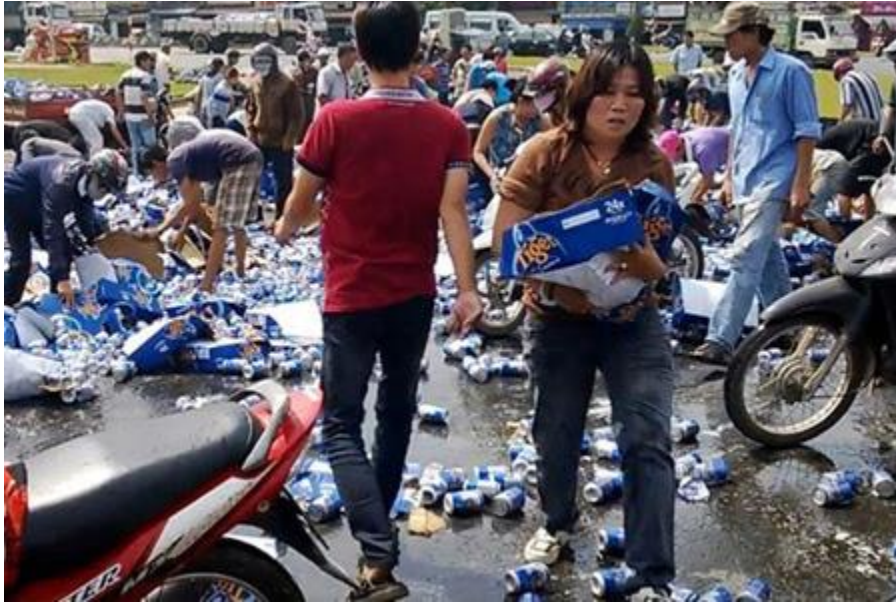
Hôi bia tại Biên Hoà.

Có thể nói Việt Nam là đất nước của khẩu hiệu đạo đức lối sống, nào là “Sống, Chiến đấu, Lao động và Học tập theo tấm gương Bác Hồ vĩ đại”, “Học tập và làm theo tấm gương đạo đức HCM”... Nhưng thực tế xã hội ngày càng điên đảo với những câu chuyện quặn lòng hoặc cười ra nước mắt: