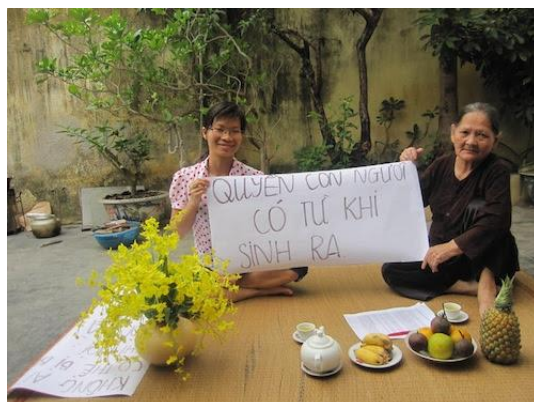
Quyền Con người.

Với hồ sơ Nhân quyền tệ hại, Việt Nam vẫn được bầu vào Hội đồng Nhân quyền LHQ nhiệm kỳ 2014-2016 với số phiếu rất cao. Bình luận về nghịch lý này, Tổ chức UN Watch có trụ sở ở Geneva, cơ quan theo dõi các hoạt động toàn diện của LHQ, nói kết nạp các quốc gia vi phạm nhân quyền có tiếng như Việt Nam, Trung Quốc làm thành viên Hội đồng Nhân quyền chẳng khác nào cho 'kẻ chuyên phóng hỏa đứng đầu sở cứu hỏa'.