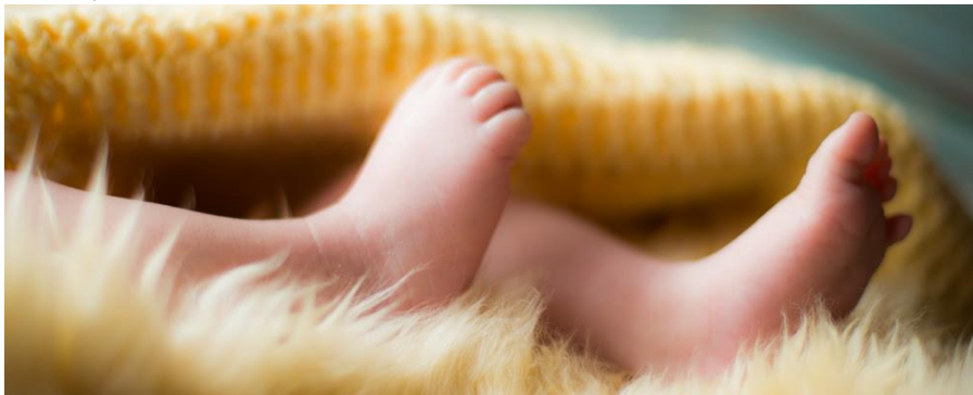
Trẻ sơ sinh (ảnh minh họa).

Nghề y bác thuốc cứu người xưa nay được xem là ngành nghề cao quý nhất trong xã hội. Dưới sự lãnh đạo của Đảng Cộng sản quang vinh suốt 68 năm ở miền Bắc và 38 năm trên toàn cõi Việt Nam, những ung nhọt trong ngành này đang bùng phát như một thứ bệnh dịch nguy hiểm. Ngoài vấn nạn chung là thiếu thốn giường bệnh, phong bì hối lộ, bảo hiểm y tế bất cập... thì năm 2013 có ba khối u ác tính nổi cộm: