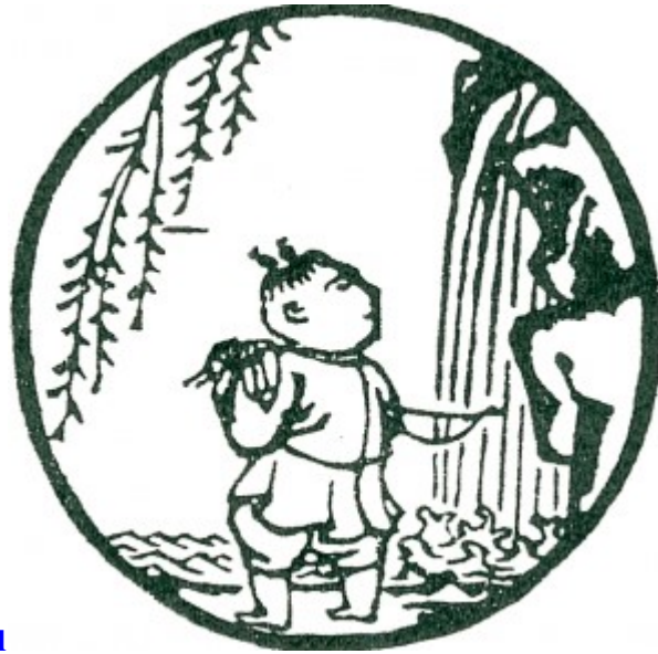
Tranh 1- Tìm Trâu

lòng nhẹ bước (tranh 5: Dắt trâu) . Chú mục đồng giờ đây vui mừng, ca hát líu lo, miệng thổi sáo, cỡi trâu về nhà (tranh 6: Cỡi trâu về nhà).