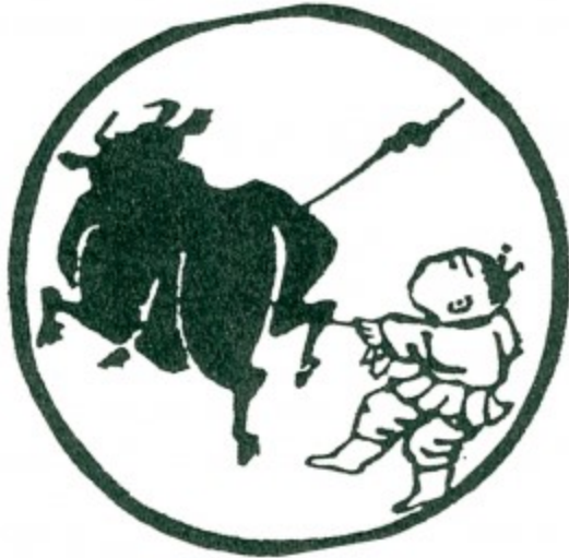
Tranh 4- Được Trâu