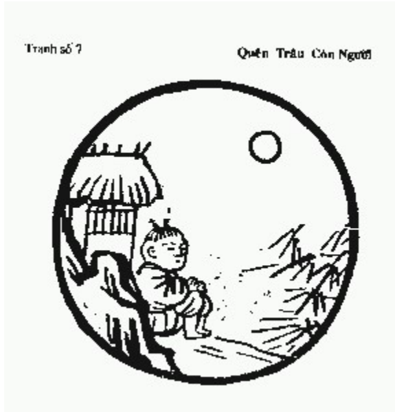
Tranh 7- Quên Trâu Còn Người