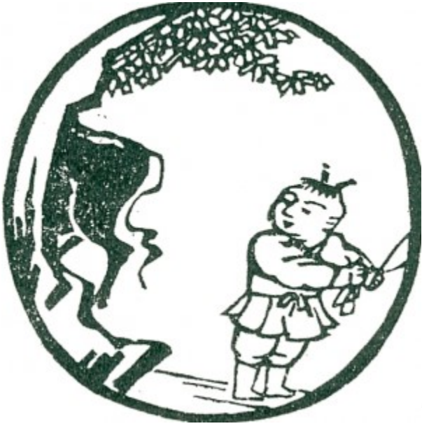
Tranh 2- Thấy Dấu