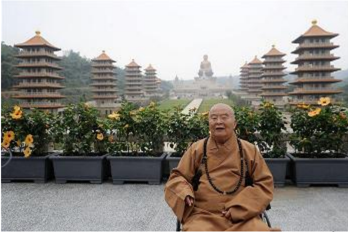
Hòa thượng Tinh Vân (Hsing Yun) và Phó Quang Sơn ở Đài Loan

Bà và chồng, một thương gia thành công, bắt đầu sống đơn sơ hơn. Họ rời các thứ xa hoa, và rồi quyên góp giúp trẻ em nghèo. Trước khi ngôi chùa khánh thành năm ngoái, bà rời tiệm tạp hóa để tới quản lý một tiệm trà gần chùa, phát nguyện các lợi tức sẽ cúng từ thiện.