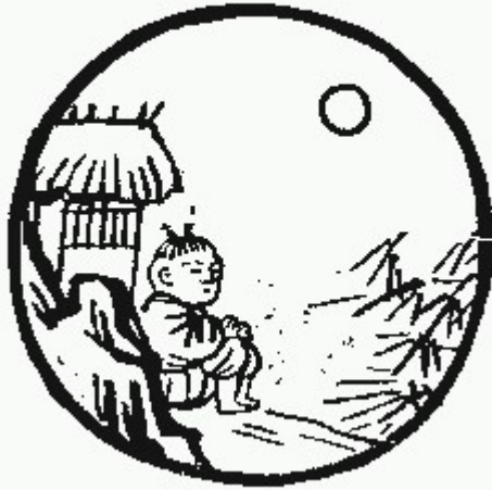
Tranh số 7: Quên Trâu còn người