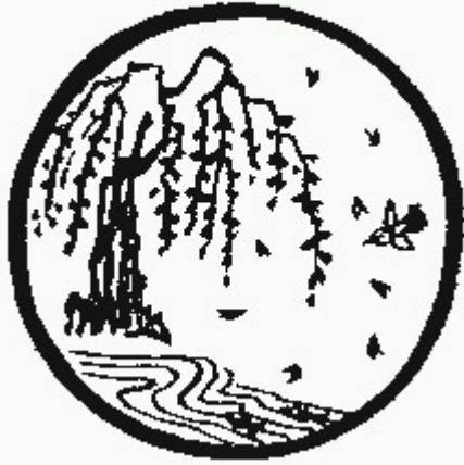
Tranh số 9: Trở về nguồn cội