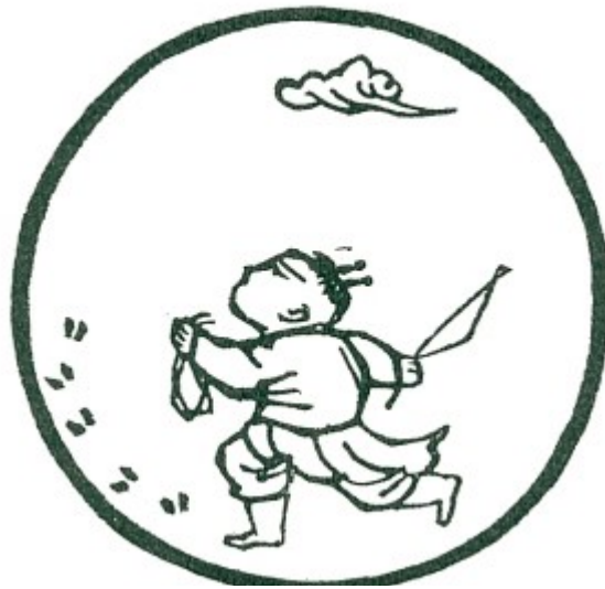
Tranh số 2: Thấy Dấu