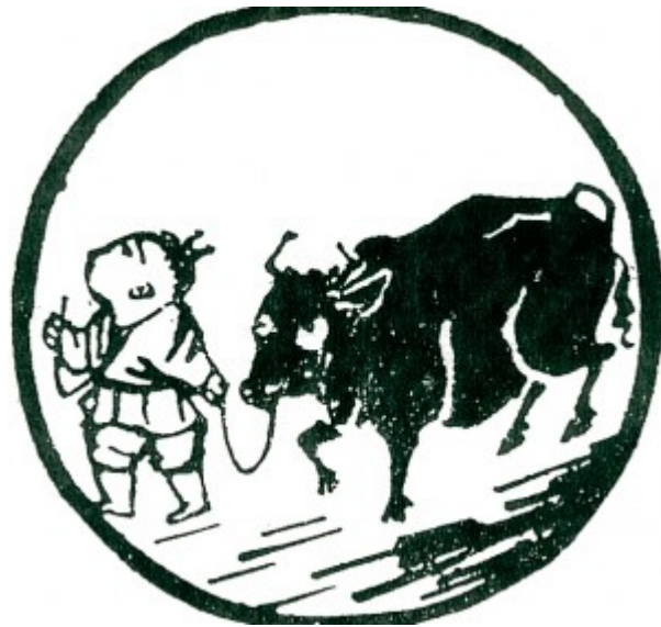
Tranh số 5: Chăn Trâu