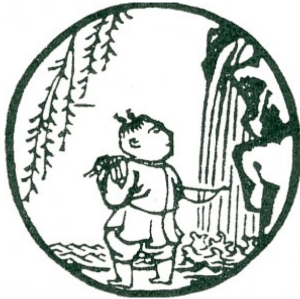
Tranh số 1: Tìm Trâu