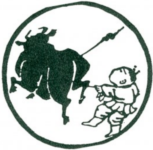
Tranh số 4: Được Trâu