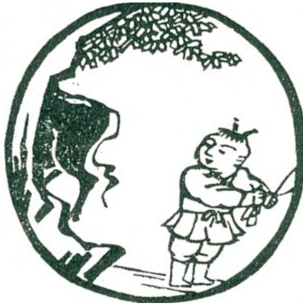
Tranh số 3: Thấy Trâu