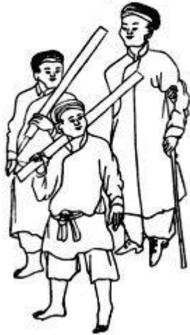
Phó trưởng tuần hành