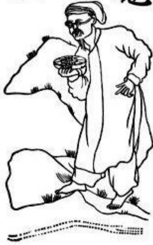
Thầy địa lí xem đất