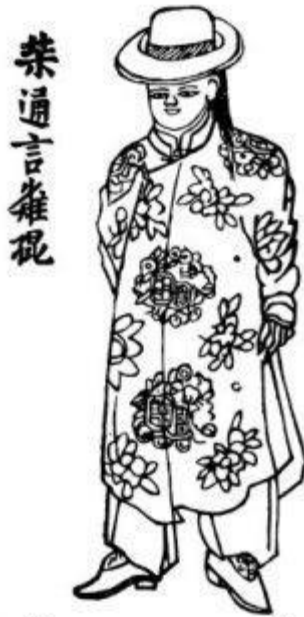
Thầy thông ngôn trẻ con.

Hết: Các Hạng Người 4 Xin Trờ Lại: http://minhtrietviet.net/muc-luc-tranh-dan-gian-3/