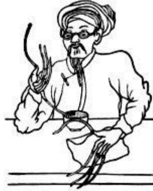
Thầy lang bốc thuốc