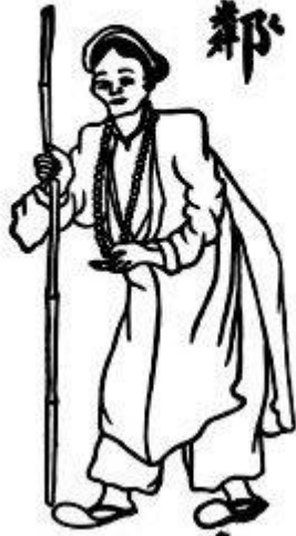
Bà vãi lần trắng hạt