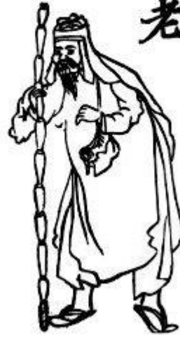
Xã từ lão (cụ từ)