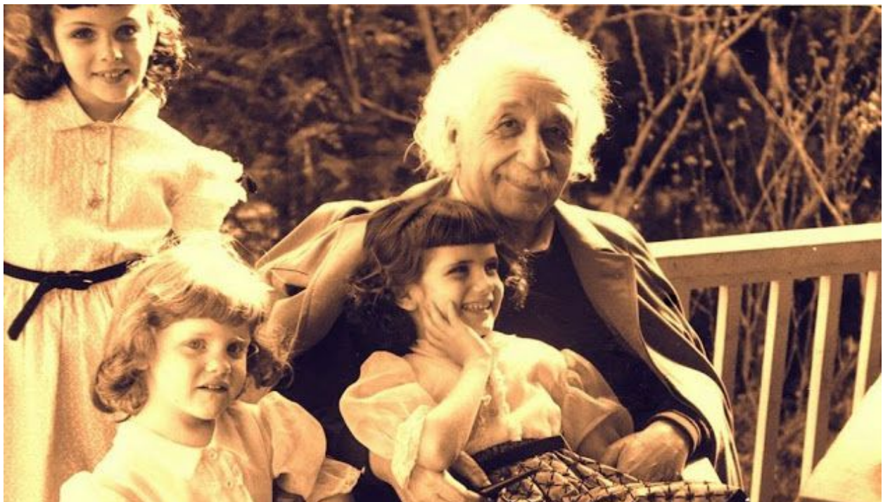
Albert Einstein và con gái