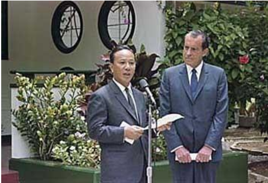
Nguyễn Văn Thiệu và Richard Nixon tại cuộc họp ở Midway 1969

Spiegel: Vậy tại sao ông lại đi trước cả người Mỹ và tự đề nghị Hoa Kỳ rút quân trong cuộc họp tại đảo Midway ở Thái Bình Dương tháng Sáu 1969, theo tường thuật của Kissinger?