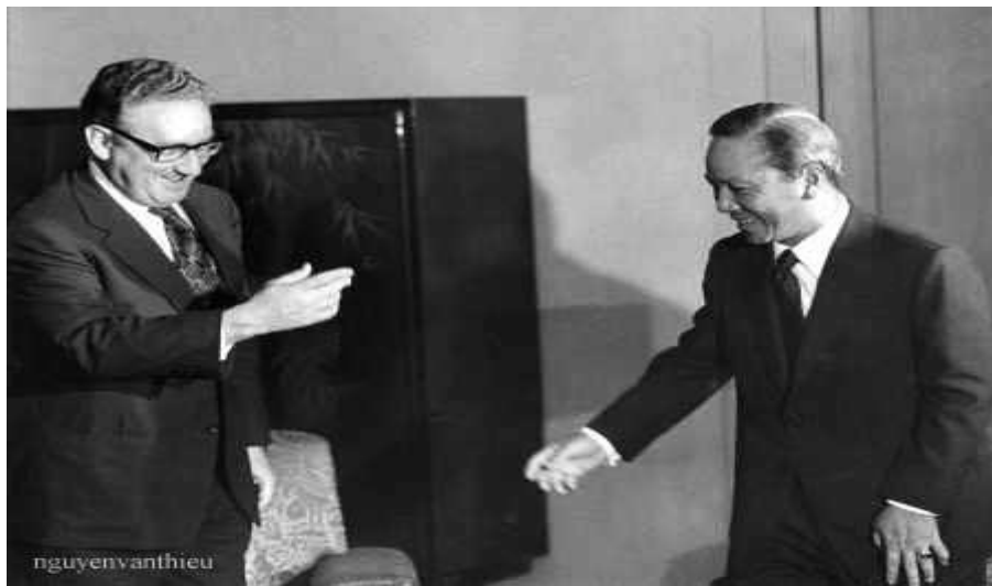
Nguyễn Văn Thiệu và Henry Kissinger

Cuối năm 1979, Cựu Tổng thống Việt Nam Cộng Hòa Nguyễn Văn Thiệu, người ít khi lên tiếng từ khi sống lưu vong sau tháng Tư 1975, đã dành cho tạp chí Spiegel của Đức một cuộc phỏng vấn dài về kết cục của Chiến tranh Việt Nam.