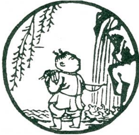
Tranh số 1: Tim Trâu

Chú mục đồng trở về với trời đất, có trời trong ta mà cũng có đất trong ta. Thế gian này trong muôn vật phân chia vọng động mà ta vẫn Bình An Thanh Tĩnh, nếu không có cảnh Sắc này làm sao ta liễu ngộ cảnh Không? Ô kia, núi vẫn là núi, mà mây cũng vẫn là mây, Tâm Hư Không mà đâu đâu không là cảnh hư không, nhìn hư huyền trong sắc giới, thấy (kiến) Chân Như giữa đời thường, Tâm Bình An chính trong vọng động. Ôi, con đường đi của Thiền giả, bước Nghĩa Hành Trí Thức An Vi ...“ Vào rừng mà không khua lá, vào nước không quậy sóng ”... Tu mà không biết mình tu, làm mà không thấy mình làm, trở về với trời đất để thấy Tâm ta là Tâm vũ trụ mà Tâm vũ trụ cũng là Tâm ta (tranh 9: Trở về nguồn cội). Và nữa, trở về với cuộc đời, với thế tục, trở về với cái Tâm Bình Thường, đất bụi đời không lem lấm được Tâm ta, thần linh hiển thánh trong từng nhất ý, nhất động của Ngôi Lời Nhập Thể và Nhập Thể (tranh 10: Thông tay vào chợ), đâu đây lời Thánh Ca vang lên ngút ngàn.