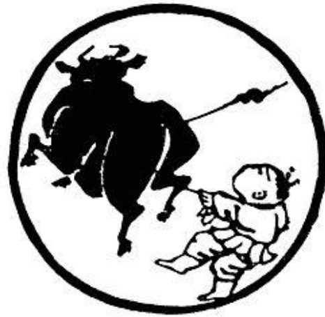
Tranh số 4: Được Trâu