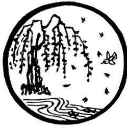
Tranh 9- Trở về nguồn cội