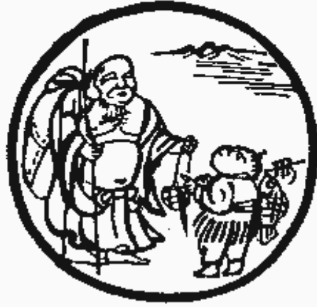
Tranh số 10: Thông tay vào chợ