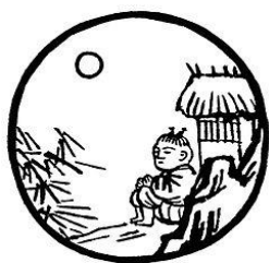
Tranh 7- Quên Trâu còn Người