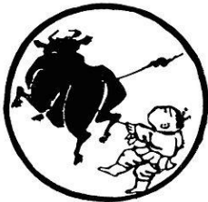
Tranh 4 - Được Trâu