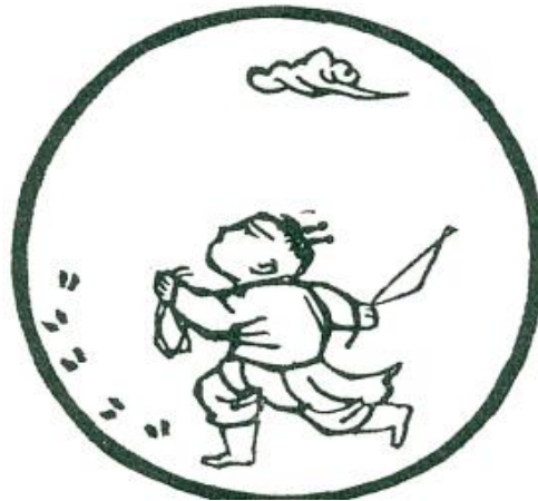
Tranh số 2: Thấy Dấu