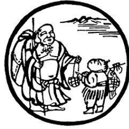
Tranh 10- Thông tay vào chợ

Chúng được Tâm Vô Tâm, sau ba bước Chỉ, Định, Tĩnh nếu nói theo An Vi (Xem Lý Tường Đại Học Việt Nho ), hoặc theo Thiền là ba cảnh giới: dục giới, sắc giới và vô sắc giới, đây là bước quyết định cực kỳ quan hệ: ta đi đâu giữa cuộc hư vô này? Đâu là nguồn cội? Thế còn nẻo trần gian, có tội tình gì? Đạo Lý vẫn thâm sâu quyến hút huyền diệu gọi mời. Đời sống cũng lắm vẻ yêu thương bao tình riêng chung đậm nhạt. Lòng ta vẫn còn thổn thức một chữ Tình. Tâm ta vẫn còn vang vọng tiếng hát siêu linh. Bỏ một trong hai mà đi, mâu thuẫn vẫn còn đó, nghịch lý mãi còn đây. Mà hình như, chúng là tự thân, không sao hủy diệt. Mất trâu, mất cả mình, chú mục đồng cảm thức cái hạt bụi chân không nặng như ba ngàn thế giới: