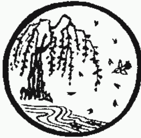
Tranh số 9: Trở về nguồn cội