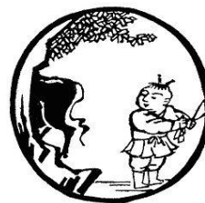
Tranh 3- Thấy Trâu