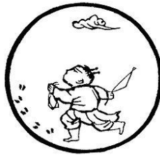
Tranh 2- Thấy Dấu