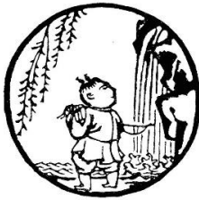
Tranh 1- Tìm Trâu