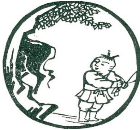
Tranh số 3: Thấy Trâu