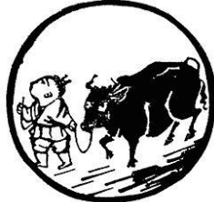
Tranh 5- Dắt Trâu