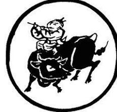
Tranh 6- Cưỡi Trâu về Nhà

Chú mục đồng đi tìm trâu, đâu cũng là hoang vu, là rừng rậm, muôn nẻo khó tìm. Tìm ở đâu? Mơ hồ cảm thấy bóng dáng trâu, phải đi tìm (Tranh 1: Tìm Trâu); rồi chú mục đồng trong mong ước tìm được trâu, sẽ thấy được dấu vết của chân trâu, trâu có trốn đâu, “Tìm sẽ gặp” (Tranh 2: Thấy dấu). Trâu vẫn đứng đó một mình, tự thưở nào, đôi sừng lẫm liệt, mũi dựng mây xanh, thế là chú mục đồng đã lần theo dấu chân trâu mà thấy được trâu ( tranh 3: Thấy trâu) rồi nắm chắc sợi dây nối để giữ trâu sau khi đã được, không dám xa lìa, sợ mất trâu, (tranh 4: Được trâu); Trâu cũng thuần hoá dễ dàng, chú mục đồng giờ yên chí hơn với con trâu ngoan ngoãn, tay dắt trâu lỏng nhẹ bước (tranh 5: Dắt trâu) . Chú mục đồng giờ đây vui mừng, ca hát líu lo, miệng thổi sáo, cỡi trâu về nhà (tranh 6: Cỡi trâu về nhà).